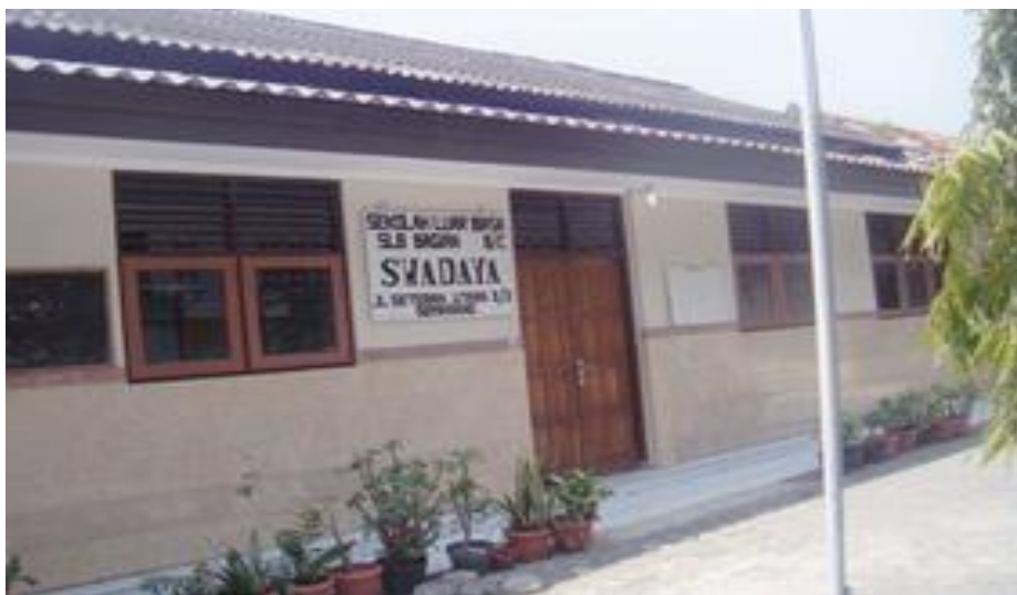
Gambar 1. SLB B,C Swadaya Semarang

Objek pengabdian pelatihan dan pendampingan peningkatan artikulasi siswa bahasa Inggris adalah siswa-siswi di SLB B,C Swadaya Semarang sebanyak sepuluh anak yang telah ditentukan oleh pihak sekolah serta memiliki gangguan tunarungu dan tunagrahita.