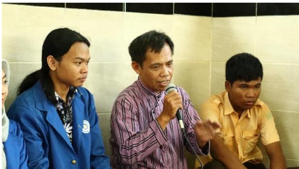
Gambar 4. Pembukaan Oleh Perwakilan Guru

Dosen dan mahasiswa melakukan peragaan dan presentasi bahasa Inggris mengenai beberapa topik diantaranya yaitu topik bagian tubuh, sayur-sayuran, dan hewan. Pada proses peragaan dan presentasi para siswa-siswi ditampilkan video animasi untuk menarik perhatian dan fokus terhadap materi pembelajaran, serta dosen dan mahasiswa membantu siswa-siswi dalam melafalkan kata serta memahami objek-objek yang dipresentasikan dalam bahasa Inggris.