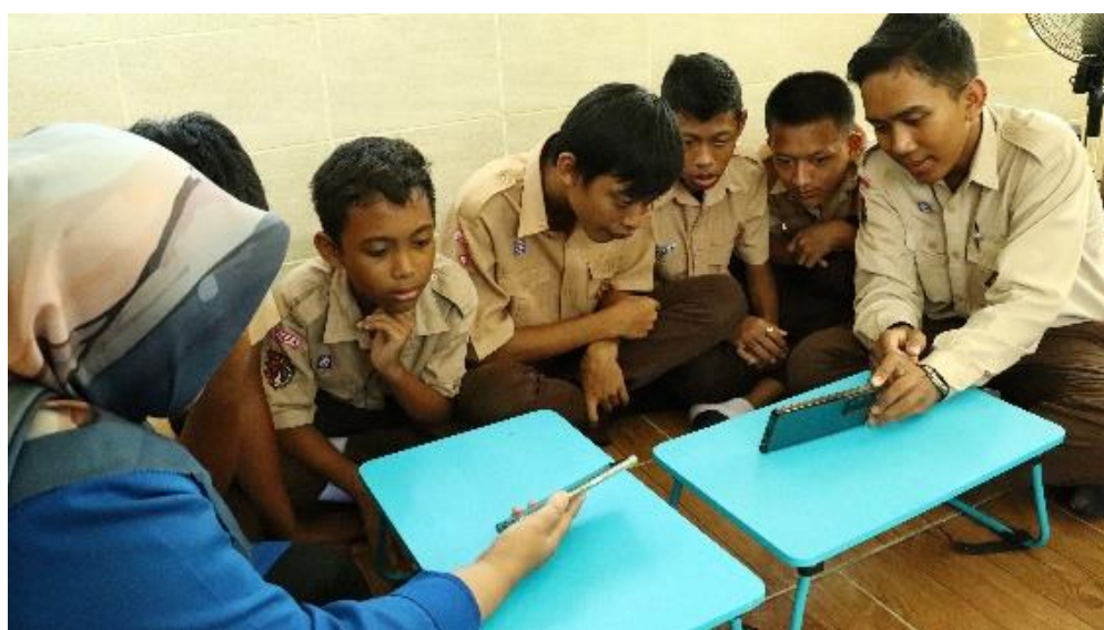
Gambar 1. Peragaan Oleh Dosen UDINUS

Dosen dan mahasiswa melakukan peragaan dan presentasi bahasa Inggris mengenai beberapa topik diantaranya yaitu topik bagian tubuh, sayur-sayuran, dan hewan. Pada proses peragaan dan presentasi para siswa-siswi ditampilkan video animasi untuk menarik perhatian dan fokus terhadap materi pembelajaran, serta dosen dan mahasiswa membantu siswa-siswi dalam melafalkan kata serta memahami objek-objek yang dipresentasikan dalam bahasa Inggris.