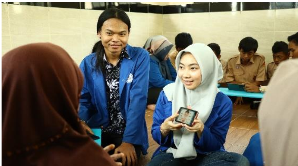
Gambar 6. Peragaan Oleh Mahasiswa UDINUS

Setelah kegiatan games selesai maka selanjutnya adalah kegiatan evaluasi kegiatan, evaluasi kegiatan dilakukan dengan memberikan kuesioner yang berisi pertanyaan terkait jalannya kegiatan pengabdian kepada responden, responden pada pengabdian ini adalah siswa-siswi serta guru yang menjadi pendamping selama kegiatan pengabdian berlangsung. Jumlah responden pada kegiatan evaluasi ini adalah sebanyak 15 orang yang terdiri dari 10 orang siswa-siswi dan 5 orang guru pendamping.