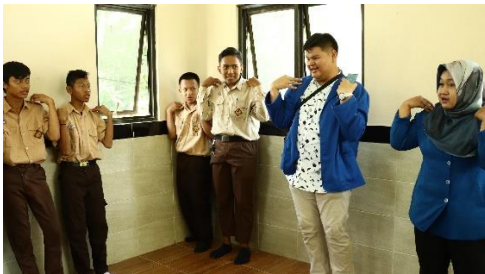
Gambar 7. Games Bersama Siswa-Siswi

Setelah kegiatan games selesai maka selanjutnya adalah kegiatan evaluasi kegiatan, evaluasi kegiatan dilakukan dengan memberikan kuesioner yang berisi pertanyaan terkait jalannya kegiatan pengabdian kepada responden, responden pada pengabdian ini adalah siswa-siswi serta guru yang menjadi pendamping selama kegiatan pengabdian berlangsung. Jumlah responden pada kegiatan evaluasi ini adalah sebanyak 15 orang yang terdiri dari 10 orang siswa-siswi dan 5 orang guru pendamping.