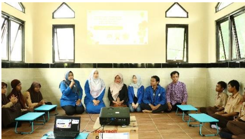
Gambar 3. Pembukaan Oleh Dosen UDINUS

Kegiatan pengabdian pelatihan dan pendampingan peningkatan artikulasi siswa bahasa Inggris yang dilakukan di SLB B,C Swadaya Semarang telah melibatkan dosen dan mahasiswa dari Universitas Dian Nuswantoro Semarang. Dosen dan mahasiswa yang terlibat dalam pengabdian ini telah melakukan peragaan dan presentasi mengenai materi video animasi berbahasa Inggris kepada siswa-siswi SLB B,C Swadaya Semarang, kegiatan tersebut dirangkum dalam dokumentasi sesuai Gambar 3 sampai Gambar 8.